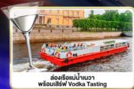
ล่องเรือแม่น้ำแคว พร้อมเสิร์ฟ Vodka Tasting