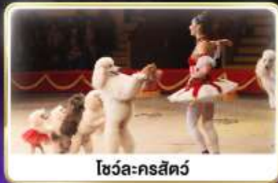
โชว์ละครสัตว์