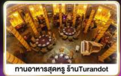
กานอาหารสุดหรู ร้านTurandot