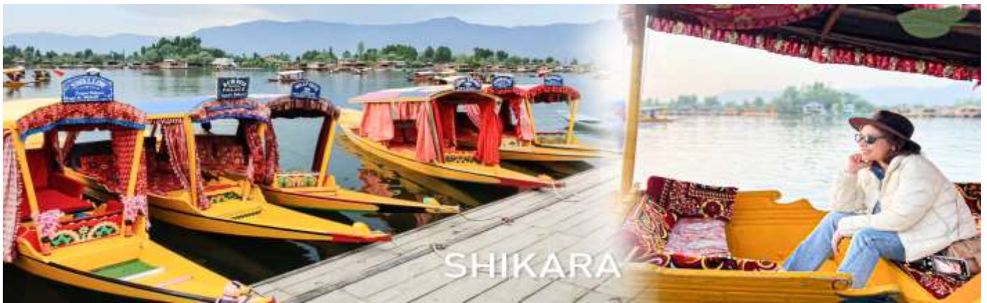
ค่า บริการอาหารเย็น ณ บ้านเรือ ที่พัก: Meena Deluxe Houseboat Srinagar หรือเทียบเท่า

และเบาะนั่งนุ่มสบายพร้อมหลังคาเพื่อกันแดดหรือฝน ล่องเรือผ่านผืนน้ำที่สงบนิ่ง ซึ่งสะท้อนภาพทิวทัศน์ของเทือกเขาหิมาลัยที่ปกคลุมด้วยหิมะ สวนสวยริมทะเลสาบ และเรือนแพ (Houseboats) ที่มีสีสันสดใส สัมผัสวิถีชีวิตท้องถิ่น ท่านจะได้เห็นชุมชนที่อาศัยอยู่ริมทะเลสาบ แปลงผักลอยน้ำ และตลาดลอยน้ำ ที่ชาวบ้านพายเรือมาขายสินค้าต่างๆ เช่น ดอกไม้ ผักสด ผ้าทอ และของที่ระลึก การล่องเรือชิวๆ ไม่ใช่แค่การนั่งเรือชมวิว แต่เป็นการเดินทางผ่านหัวใจและวัฒนธรรมของแคชเมียร์ ที่จะมอบประสบการณ์ที่น่าจดจำและผ่อนคลายให้กับคุณ...ได้เวลาอันสมควรนำท่านเข้าสู่ที่พักบ้านเรือ มาถึงแคชเมียร์ ต้อง!! เปิดประสบการณ์พักในบ้านเรือ หรือ House Boat