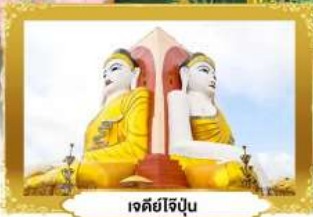
เจดีย์ไข่มุก