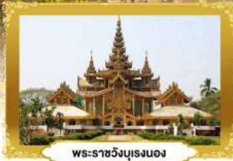
พระราชวังบุเรงนอง