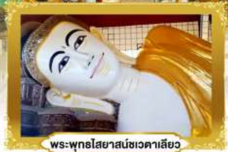
พระพุทธรูปไสยาสน์ชเวดากอง