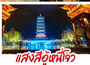
แสงสีอู่เหน็โจว