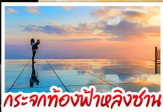
กระจกท้องฟ้าหลิงซาน