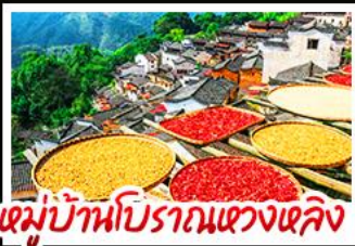
หมู่บ้านโบราณแขวงเหล็ก

- หุบเขาเทวดา "วังเซียนกู่" - หมู่บ้านโบราณหวงหลิง - กระจกท้องฟ้าหลิงซาน - แสงสีอู่เหน็โจว