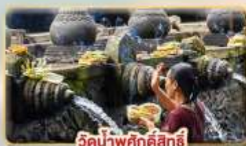
วัดน้ำพุกคักคัสสิริงค์