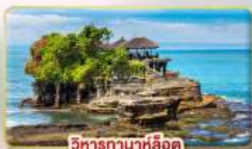
วิหารกานาห์ลอค

พื้ตเมือง Kuta ระดับ 3 ดาว หรือเทียบเท่า