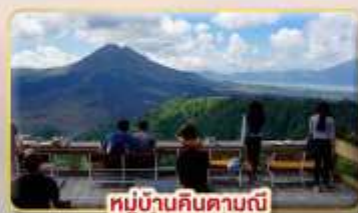
หมู่บ้านคินตามัน