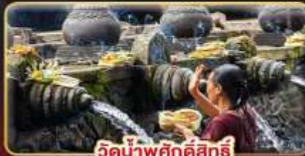
วัดน้ำพุศักดิ์สิทธิ์