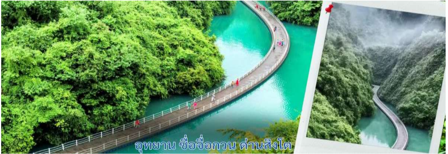
อุทยาน ชื่อจื่อกวน ด้านสิงโต

สะพานนี้ถือเป็นหนึ่งใน สะพานลอยน้ำที่ยาวและสวยที่สุดในจีน รถอุทยานสามารถวิ่งข้ามสะพานได้ ตอนเล่นผ่านคือทั้ง ตื่นเต้นและประทับใจมาก เพราะวิวรอบตัวคือภูเขาเขียวขจีและผืนน้ำที่สะท้อนท้องฟ้าอย่างสวยงาม