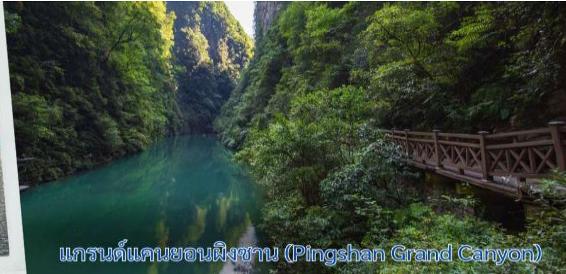
แกรนด์แคนยอนผิงซาน (Pingshan Grand Canyon)