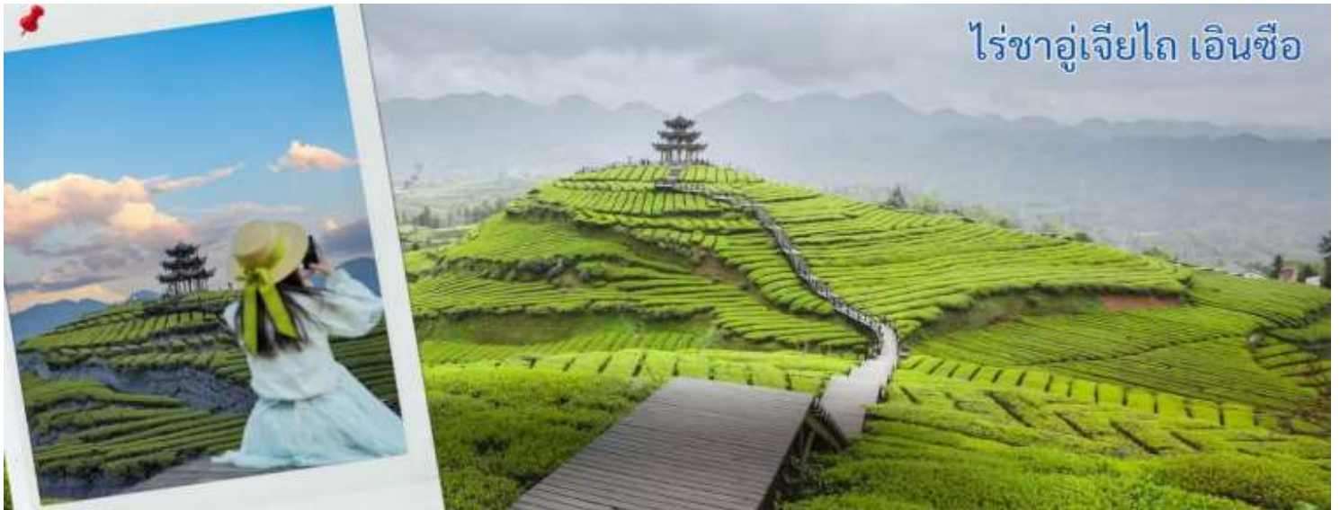
ไร่ชาอู่เจียไถ เอ็นซี

หลังจากรับประทานอาหารกลางวัน นำทุกท่านเดินชม ภูเขาใบชาอู่เจียไถ คือแหล่งมรดกโลกที่ตั้งอยู่ในเขตภูเขา มณฑลชานซี ประเทศสาธารณรัฐประชาชนจีน เป็นหนึ่งในสี่ภูเขาอันศักดิ์สิทธิ์ทางพุทธศาสนาของจีน ณ ภูเขาอู่ไถแห่งนี้เป็นที่ประทับของพระมัญชุศรีโพธิสัตว์ ธรรมราชาภุมารในคติของพระพุทธศาสนาหายาน ได้รับการจัดระดับโดยคณะกรรมการจัดระดับคุณภาพสถานที่ท่องเที่ยวแห่งประเทศไทยระดับ 5A เมื่อปี 2550 ภูเขาใบชาอู่เจียไถ ตั้งอยู่ในเขตชานฮั่น มณฑลหูเป่ย์ ประเทศจีน เป็นแหล่งผลิตชาคุณภาพสูงที่มีชื่อเสียง โดยเฉพาะชา กังฉา ซึ่งเคยเป็นชาชั้นสูงที่ถวายแด่ฮ่องเต้ในอดีต แม้ว่าข้อมูลในวิกิพีเดียภาษาไทยจะเน้นไปที่เขาผู่ถั่ว (ที่ประทับพระแม่กวนอิม) หรือเขาอู่ไถ (หนึ่งในสี่ภูเขาศักดิ์สิทธิ์) แต่ อู่เจียไถ เป็นที่รู้จักในฐานะไร่ชาที่มีทิวทัศน์สวยงามและผลิตชาชั้นดี มีการจำหน่ายและให้ชิมชาชา ชาเขียว และชาท้องถิ่น