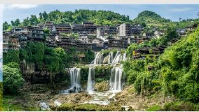
หมู่บ้านโบราณฝูหลงเจิน