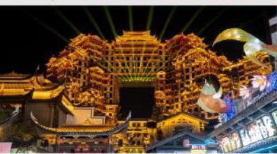
ตีทมส์จอร์จีย์ 72