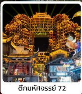
ตึกมหัศจรรย์ 72