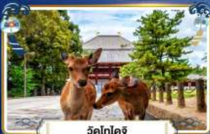
วัดโทไดจิ