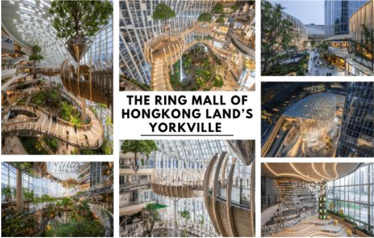
THE RING MALL OF HONGKONG LAND'S YORKVILLE