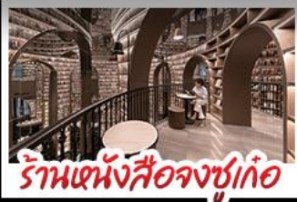
ร้านอาหารสี่ดรุณี

อุทยานภูเขาสี่ดรุณี อุทยานป่าเขิงโกว หมี่แพนด้านอนเซลพี รับประทานอาหารที่ วัดต้าฉือ ถนนโบราณความจำ ซุปปังย่านคิง ถนนไท่กูหลี่ + ถนนซุนซู่ เมนูพิเศษ สุกี้หมาล่าเสวน