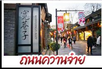
ถนนความจำ