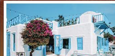
SON TRA MARINA CAFE