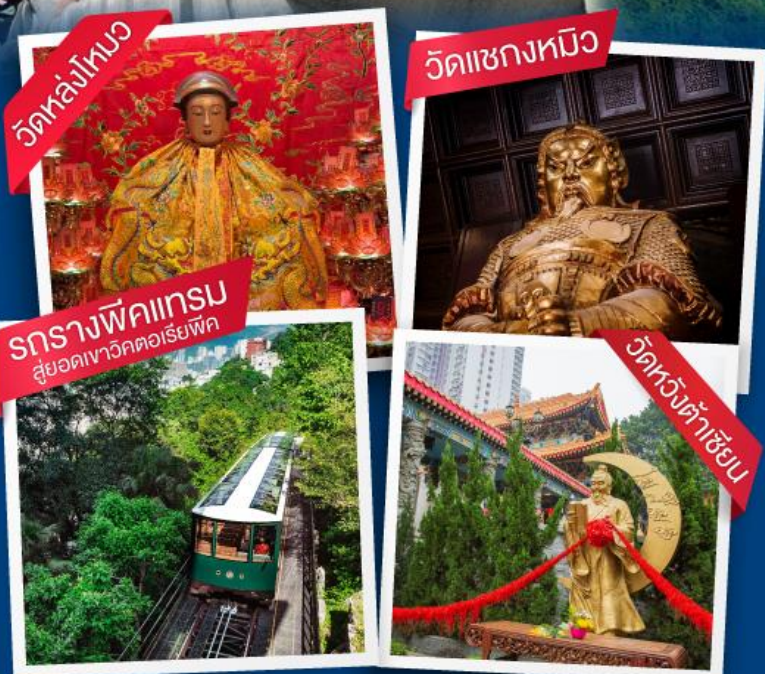
วัดหล่งโคม