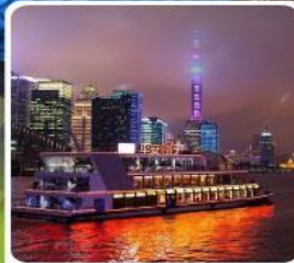
ล่องเรือแม่น้ำหวงผู่