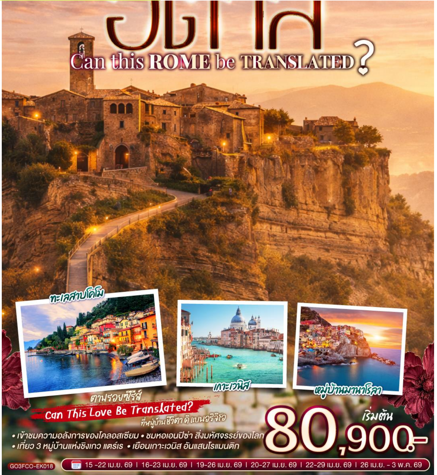
ทะเลสาบคิมี