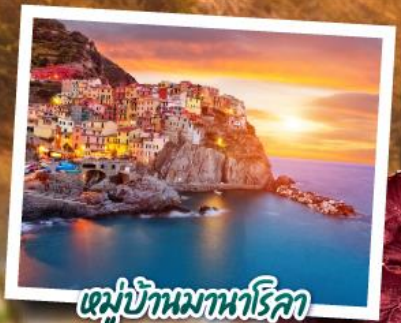
หมู่บ้านมานาโรลา