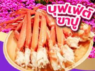
บุฟเฟ่ต์ขาปู