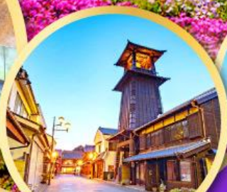
หอระซังโทคิโนะคาเนะ