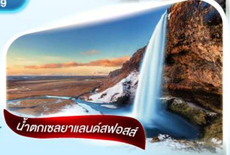
น้ำตกเซลยาแลนด์สฟอสส์