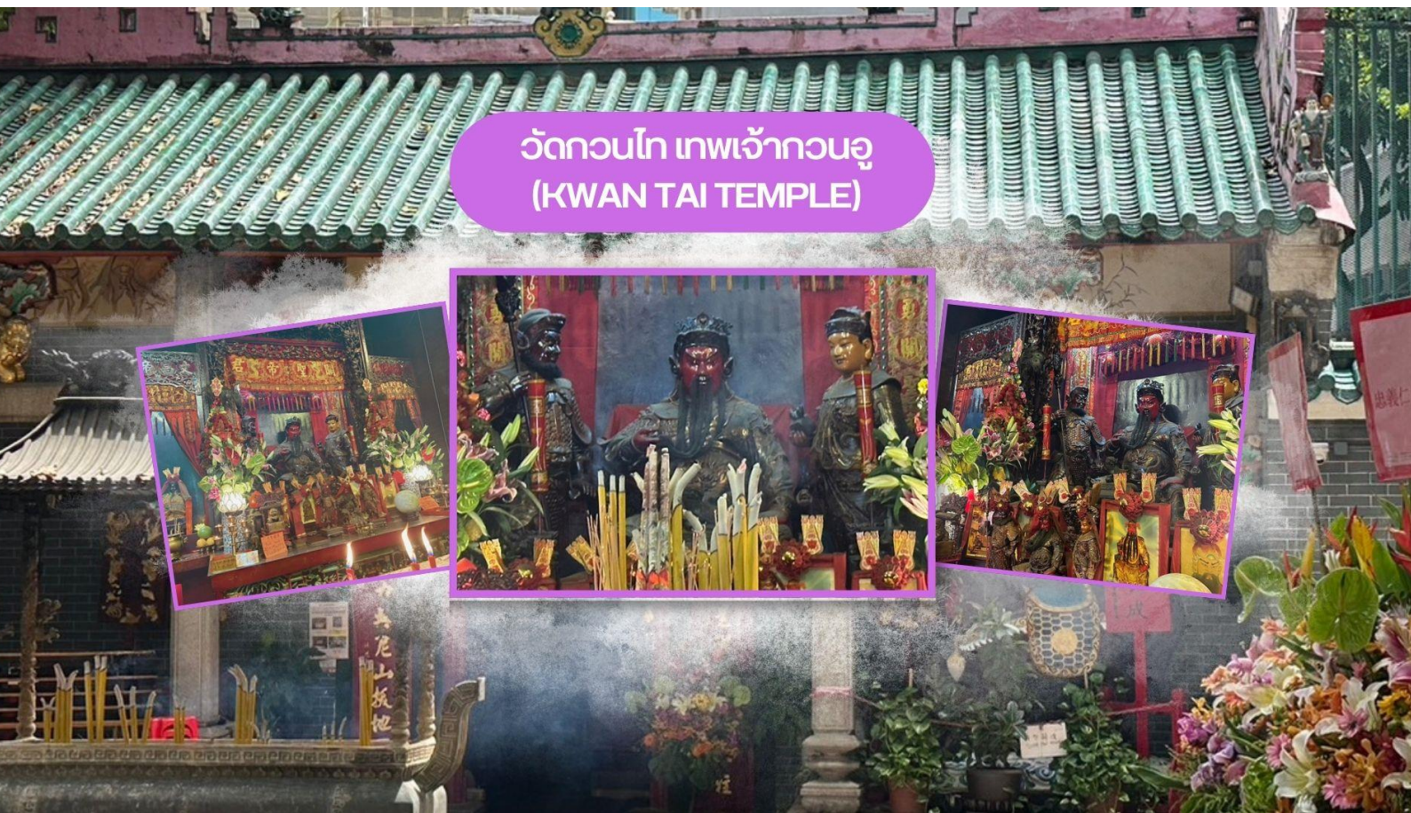
วัดกวนไท เทพเจ้ากวนอู (KWAN TAI TEMPLE)

จากนั้นนำท่านเดินทางสู่ วัดกวนไท (Kwan Tai Temple) สร้างขึ้นในปี 1891 เพื่อบูชาเทพเจ้ากวนอู ซึ่งเป็นเทพเจ้าแห่งความซื่อสัตย์ และเปี่ยมไปด้วยคุณธรรม ภายในวัดมีรูปปั้นกวนอูขนาดใหญ่ตั้งอยู่ที่แท่นบูชา มีผู้คนจำนวนมากมาสักการะท่านกวนอูเพื่อขอพรให้ประสบความสำเร็จในธุรกิจ เรื่องความโชคดี โชคลาภ การค้าขาย และการปกป้องคุ้มครอง