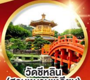
วัดซีหลิน (สวนหนานเท่ลิย่น)