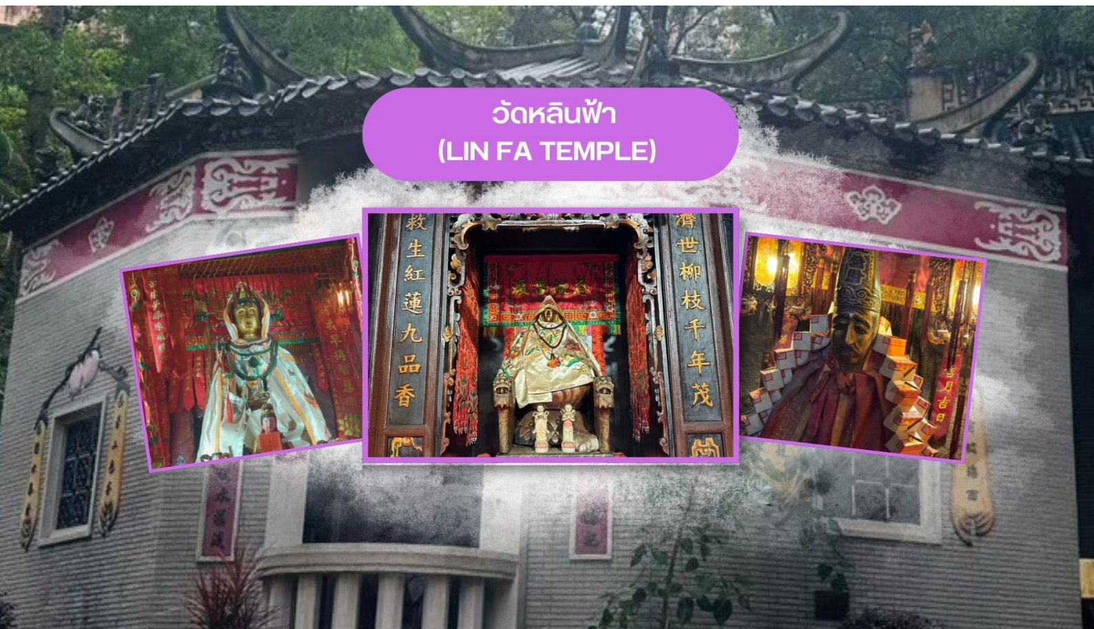
วัดหลินฟ้า (LIN FA TEMPLE)

ฮ่องกง เมืองแห่งสีสันและวัฒนธรรมที่ไม่เคยหลับใหล เป็นเมืองที่เต็มไปด้วยพลังและชีวิตชีวา ตั้งอยู่บนชายฝั่งทางตอนใต้ของจีน ที่นี่เป็นศูนย์กลางทางเศรษฐกิจ การเงิน และการท่องเที่ยวระดับโลก ผสมผสานระหว่างวัฒนธรรมตะวันออกและตะวันตกได้อย่างลงตัว