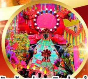
วัดเจ้าแม่กวนอิมฮ้องฮ่า