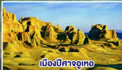
เมืองปีศาจอุทอ