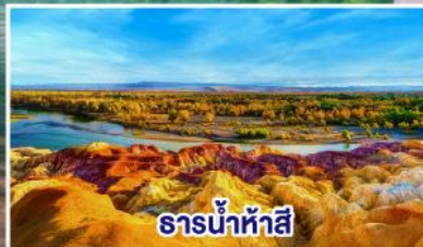
ธารน้ำห้าสี