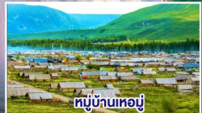
หมู่บ้านเหมอมู่