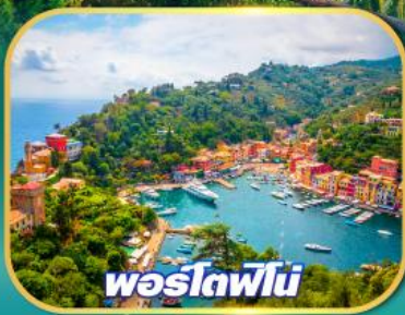
พอร์ตฟีโน