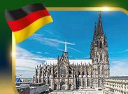
มหาวิหารแห่งเมืองโคโลญ