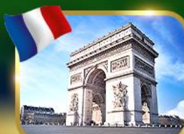
ประตูชัยฝรั่งเศส ปารีส