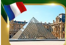
พีระมิดที่ลูฟวร์ ปารีส