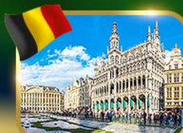
จัตุรัสกรอนด์ ปลาซ บริซเซลส์