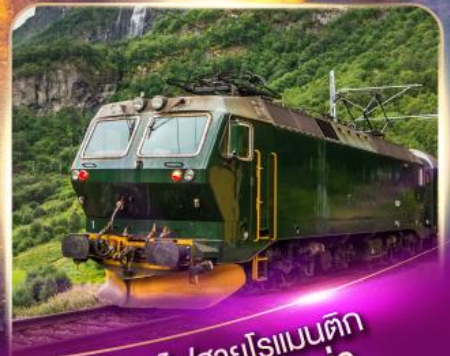
รถไฟสายโรแมนติก ฟลัมส์บาน่า