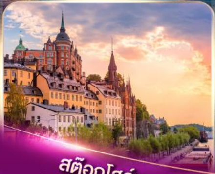
สต็อกโฮล์ม เวนิสแห่งยุโรปเหนือ