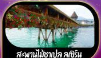
สะพานไม้ชาเปล ลูซิิร์น