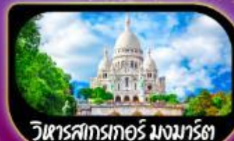
วิหารสกรเทอร์ มงมาร์ต