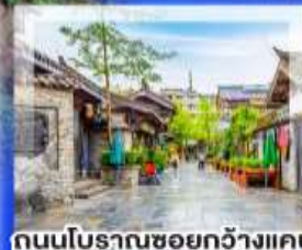
ถนนโบราณชอยกวางแคบ