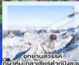
อุทยานสวรรค์ ภูผาหิมะกลาเซียร์ตำกู่ปิงชวน